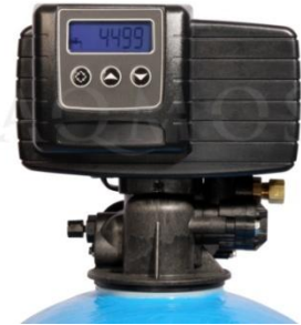
Abb. 2: Steuerventil Fleck 5600 SXT

GFK- Druckflasche, gefüllt mit hochwertigem Ionenaustauscherharz, Kabinettgehäuse für einen Salzvorrat von max. 40 kg, abnehmbarer Deckel, mengengesteuertes Zentralsteuerventil Typ FLECK 5600, integriertes Feinverschneidungsventil, Absaugeinrichtung und Verbindungsleitung zum Zentralsteuerventil.