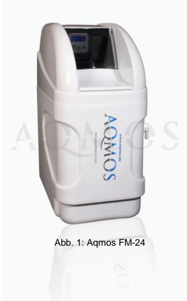
Abb. 1: Aqmos FM-24