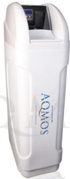
Abb.1: Aqmos FM-80